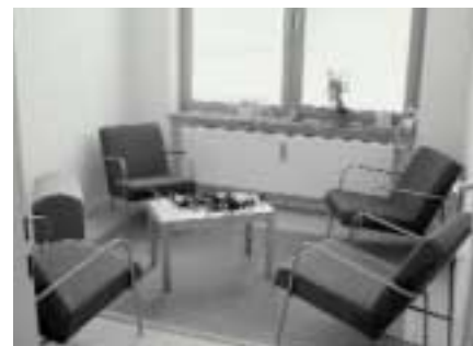
Das helle, freundlich eingerichtete Beratungszimmer bietet einen guten Rahmen für Gespräche mit Familien