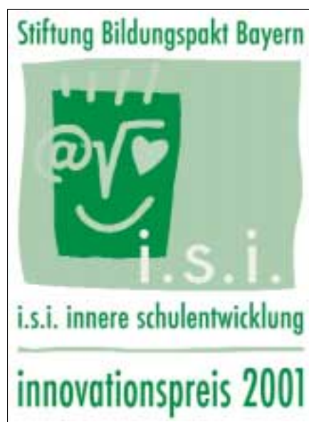
Die Dr.-Elisabeth-Bamberger-Schule führt als „ausgezeichnete Schule“ das i.s.i.-Logo als Qualitätssiegel

Im Mittelpunkt der Feier stand jedoch die Preisverleihung. Groß war die Freude, als schließlich die Dr.-Elisabeth-Bamberger-Schule in Dachau, unsere Förderschule zur Erziehungshilfe, den dritten Preis inklusive 1000 Euro entgegennehmen konnte. Sie erhielt damit das Privileg, künftig das i.s.i.-Logo als Qualitätssiegel zu führen und sich