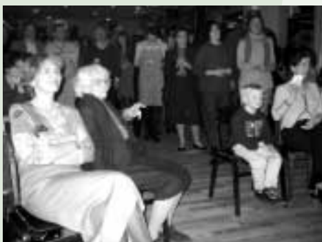
Zauberlehrlinge, konzentriert bei der Sache

Unter diesem Motto stand die Einladung an alle Mitarbeiterinnen und Mitarbeiter sowie deren Angehörige und Freunde zum krönenden Abschluss des 100-Jahre-Jubiläums des Kinderschutz und Mutterschutz e.V. In der Rückschau auf die „heiße Party“ am Abend des 2. März 2002 lässt sich festhalten, dass uns die Umsetzung dieses Vorsatzes ziemlich gut gelungen ist: Mehr als 230 Gäste feierten in der Max-Emmanuel-Brauerei in den 101. Geburtstag des Kinderschutz und Mutterschutz e.V. hinein. Manche hielten die Stellung, bis die Aufräumarbeiten der Kellnerinnen nicht mehr zu übersehen waren. Ein Buffet, das keine Gaumenwünsche offen ließ, eine Band, deren Aufspiel-Freude nicht zu stoppen war, ein DJ, der die musikalischen Vorlieben seines Publikums stilsicher zu treffen wusste und natürlich die Beiträge aus den Reihen der Mitarbeiterinnen und Mitarbeiter (wer hat schon einen der Zaubertricks privat ausprobiert?) haben wesentlich zum Gelingen des Festes beigetragen. Spektakulär war auch die ungeahnte Begeisterung für's Tanzen in unseren Reihen: Gleich bei der ersten Einlage der Band war das Parkett voll, und bis zum Kehraus um 2.30 Uhr war für jeden Geschmack etwas dabei!