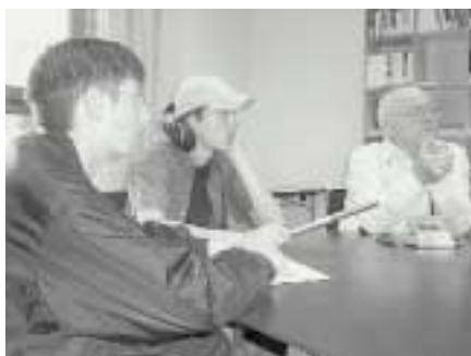
Schüler im Gespräch mit Überlebenden des KZ Dachau

Besonders stolz sind dabei alle Beteiligten auf zwei Erfolge: Zum ersten hat ein Team aus Schülerinnen und Schülern, Lehrerinnen und Lehrern sowie Sozialpädagogen