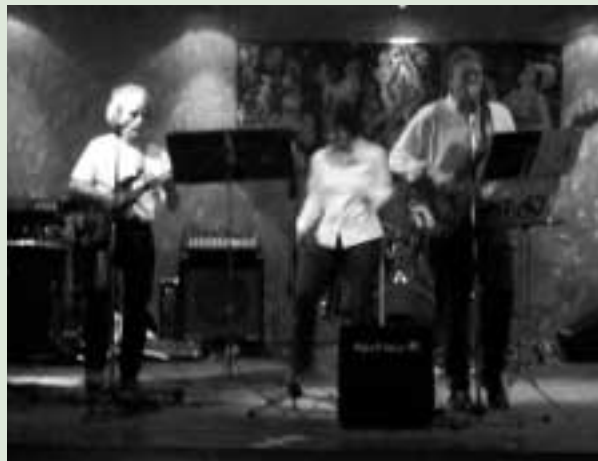
Sorgen für Stimmung: Die Band Avanti Dilettanti