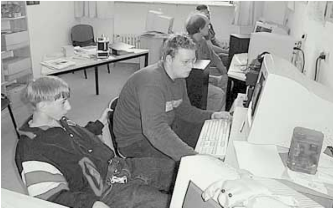
Schüler im Computerraum des Schülerzentrums Schlossberg

Ein Multimediaprojekt des Schülerzentrums Schlossberg als Beitrag im Siemens-Wettbewerb „Join Multimediaprojekt 2001“