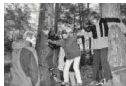
„Seiltanzen“ ist gar nicht so einfach – Koordination und Zusammenarbeit wollen geübt sein!