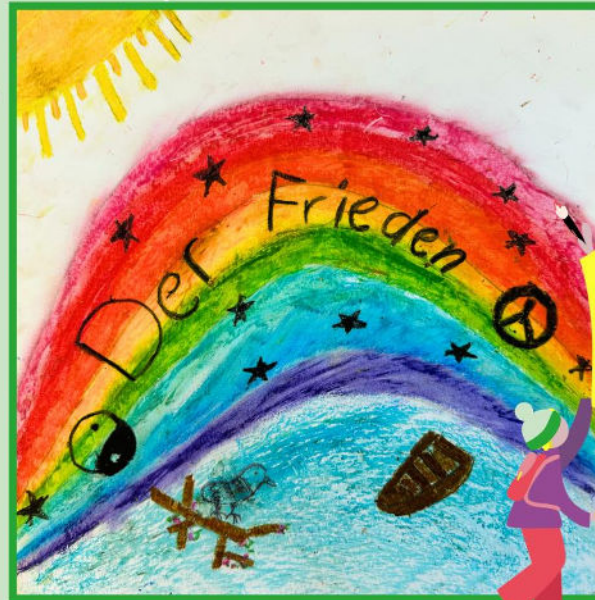
Gemalt von Emilia, 10 Jahre alt.